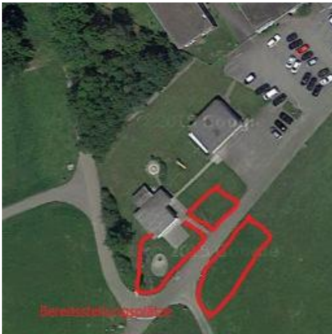
Rot markiert: Bereitstellungsplätze